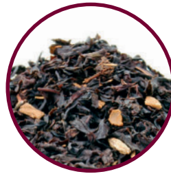
Nr. 946 Karl-Heinz, der Herbsttee®

«Der ideale Schietwettertee, sehr wohlschmeckend, Anis nur höchst dezent.»