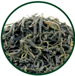
Nr. 719 Japan Kamairicha

«Pfannengeröstete Grüntees sind in Japan eine Seltenheit und wir sind froh, einen Teebauern für diese Spezialität gefunden zu haben. Der Tee erinnert aufgrund seiner feinen Röstnoten an chinesische Grüntees, doch die Eigenheiten der japanischen Kultivare geben diesem Grüntee einen einzigartigen Geschmack.» Tea Taster Bewertung von Lukas Parobij