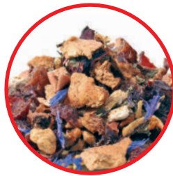
Nr. 1434 Fruchtetee Granatapfel-Minze